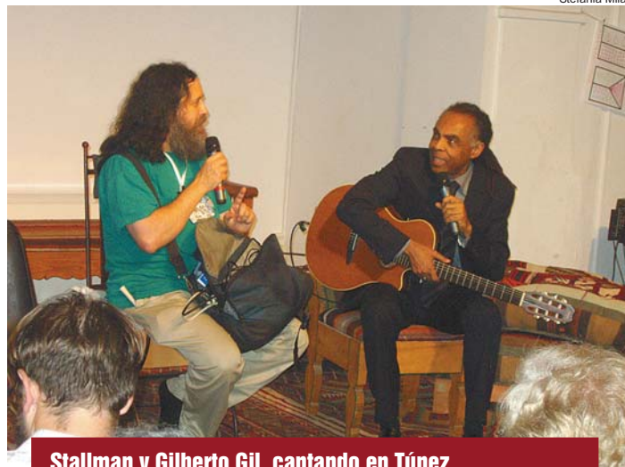
Stallman y Gilberto Gil, cantando en Túnez

Un programa es libre si respeta las cuatro libertades esenciales, y si pue-